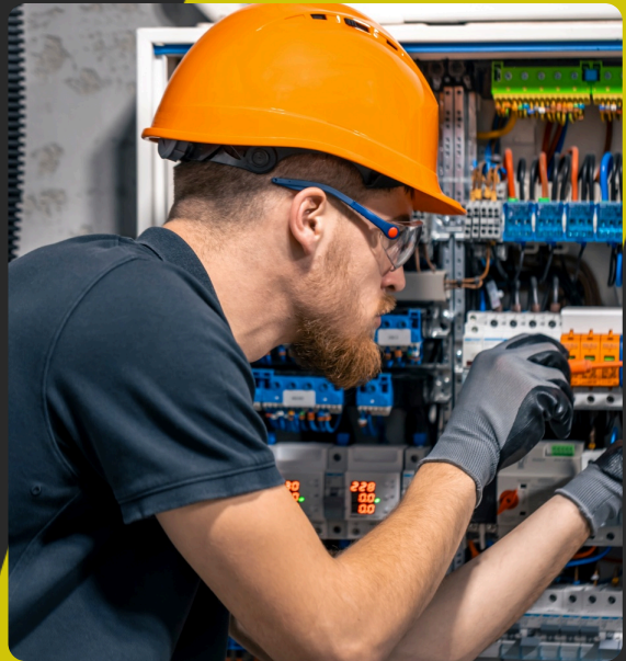
Type : Habilitation Electriques