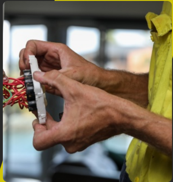
Type : Habilitation Electriques

Durée : 1 à 2 jours - 7 à 14 heures (en fonction du titre d'habilitation)